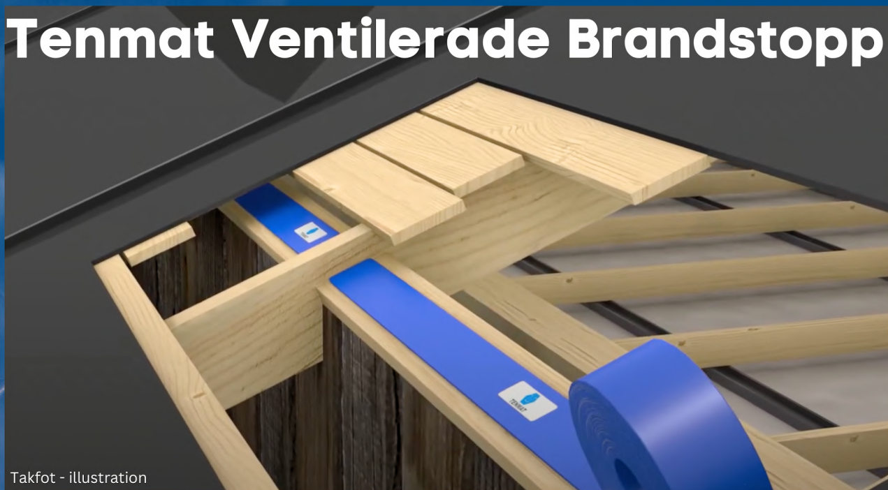
Takfot - illustration