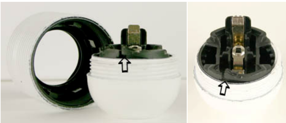
Tältä läppä näyttää kun lampunpidin (E27) on purettu

Kieleke on pieni muovinen läppä E27-kantaisissa lampunpitimissä. Paina läppä pohjaan, tai sisäänpäin pienellä ruuvimeisselillä samalla kuin käännät pidintä myötäpäivään.